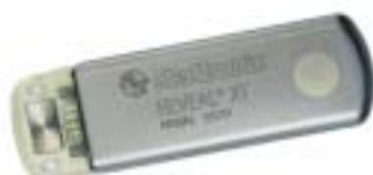
Νέα Εμφυτεύσιμα Holter Reveal XT Reveal DX