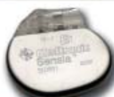
Νέα Σειρά Sensia Completely Automatic