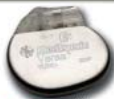
Νέα Σειρά Versa Completely Automatic

Βηματοδοτικά Ηλεκτρόδια Capsure Z Novus CapsureFix