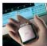
GEM II AT

Εμφυτεύσιμος ανηλιδτής με ΑΥΤΟΜΑΤΕΣ ΘΕΡΑΠΕΙΕΣ και αλγόριθμους πρόληψης ΚΟΛΠΙΚΗΣ ΤΑΧΥΚΑΡΔΙΑΣ.